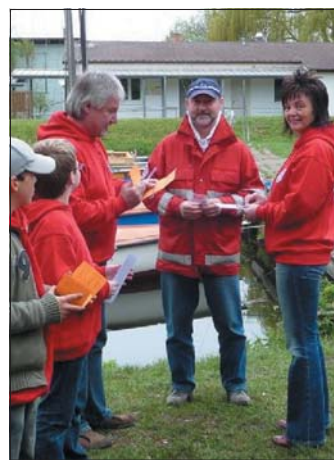
Urkunden für Mutti und Sohn

Sommerkonzert in der Ueckermünder Kreuzkirche